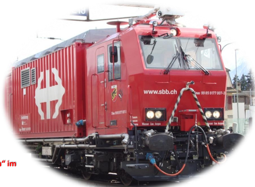
SBB-Löschzug „Bern“ im Bahnhof Thun.